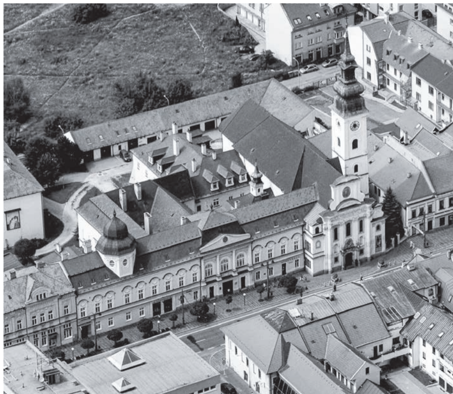
Катедральний собор Івана Хрестителя у Пряшеві