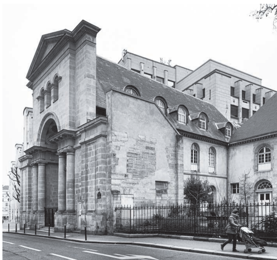
Катедральний собор Єпархії Святого Володимира Великого УГКЦ у Парижі