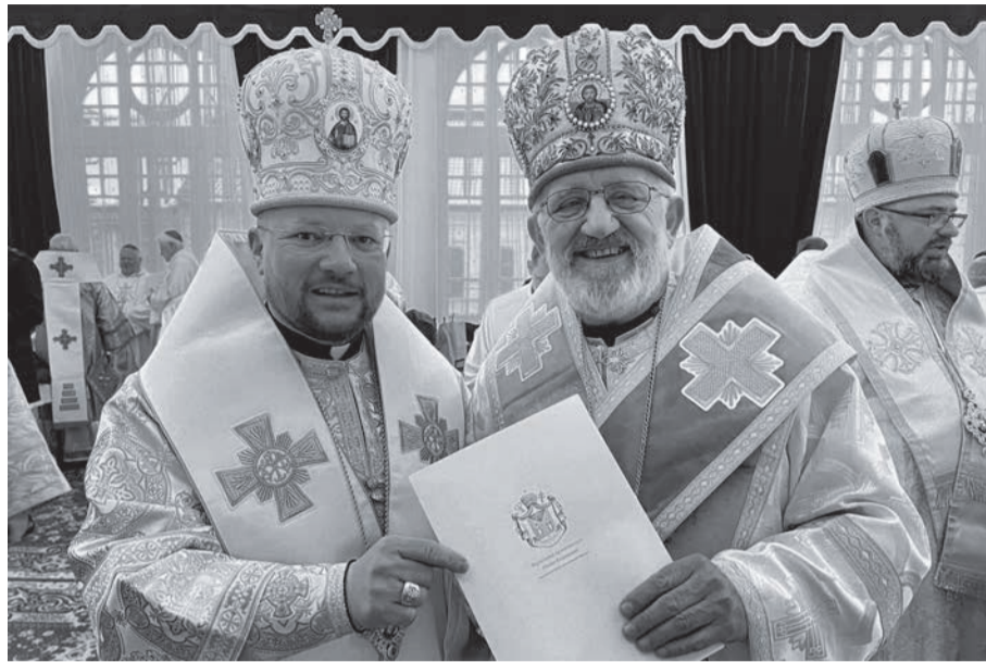
Владика Степан Сус і владика Петро Руснак, Пряшів, 28 січня 2023 р.

Отець і Глава УГКЦ Блаженніший Святослав особисто та від імені Синоду Єпископів Української Греко-Католицької Церкви привітав владика Петра Руснака, апостольського адміністратора sede vacante Пряшівської архієпархії, та всіх вірних із нагоди 15-ї річниці піднесення її до рівня митрополії, яке здійснив світлої пам'яті Папа Венедикт XVI. «Засилаю вам усім сердечні побажання із пагорбів нашого сивочолого Дніпра, на якому, як символ нерозривної єдності нашої Церкви, зведено собор Воскресіння Христового, у час, коли наша рідна земля здригається від бомбардувань, коли плач і сум через важкі втрати, спричинені безпощадним агресором, сповнює наші серця. Та, незважаючи на ці випробування, Україна молиться, бореться і перемагає!» – пише Глава УГКЦ у привітанні.