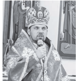
Владика Йосафат (Мошич)

У 1990-х роках чернівецька громада УГКЦ входила до складу Івано-Франківської єпархії УГКЦ. У 1993 році було утворено Коломийсько-Чернівецьку єпархію. Чернівецький собор Успіння Пресвятої Богородиці набуває статусу Прокатедрального собору Коломийсько-Чернівецької єпархії. 17 квітня 2006 року правлячий єпископ Коломийсько-Чернівецької єпархії влади́ка Миколай (Сімкайло) проголосив створення Буковинського вікаріату Коломийсько-Чернівецької єпархії Української Греко-Католицької Церкви.