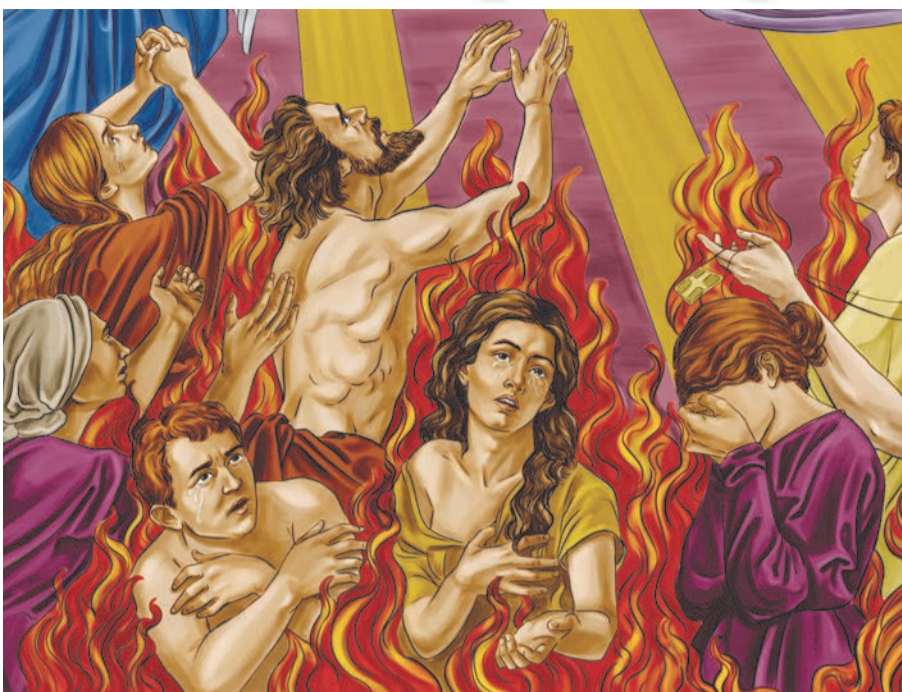
«Чистилище», ескіз вітражу (фрагмент).

Мт. 5, 48: «Будьте досконалі, як досконалий Отець ваш Небесний». Силою принципу № 2 – ніщо