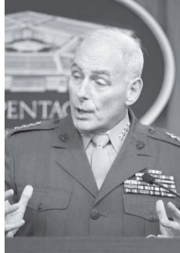
Голова Міністерства Внутрішньої Безпеки генерал Джон Келлі

Щойно приступивши до своїх обов'язків, Меттіс і Келлі показали, що вони готові боронити принципи Католицької Церкви навіть тоді, коли це