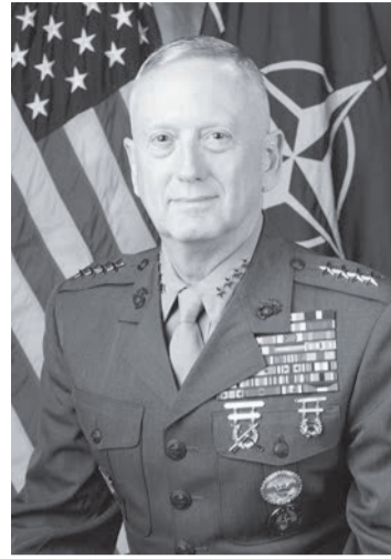
Міністр Оборони США генерал Джеймс Маттіс

Тут вартує нагадати і про листа, що його написав тодішній кандидат, а тепер