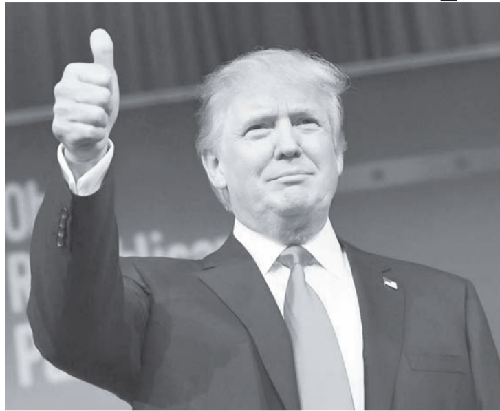
Президент Сполучених Штатів Америки Дональд Трамп

М абуть, буде дивним достосувати слово «католицький» до світових політичних процесів, але в новій американській адміністрації чітко прослідковується новий тренд: більшість високо позиціонованих чиновників, які несуть відповідальність за структури оборони і національної безпеки – католики. Про це пише «Католицький оглядач», посилаючись на Стівена Біла, матеріал котрого опубліковано на сторінках «National Catholic Register».